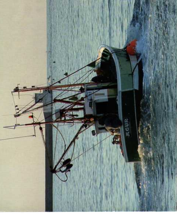
Graphisme : www.jean-montfort.fr